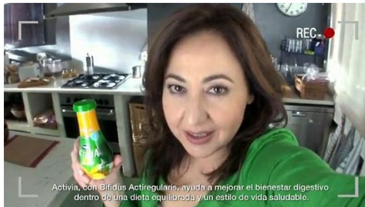
Figura 1. La actriz Carmen Machi anunciando Activia de Danone

Como sostienen Agrawal y Kamakura (1995, p. 56), el uso de las celebridades en comunicación incrementa la credibilidad de los mensajes, aumenta el recuerdo y el reconocimiento de las marcas anunciadas, mejora la actitud hacia la organización que vende el producto, e incluso incrementa la probabilidad de compra.