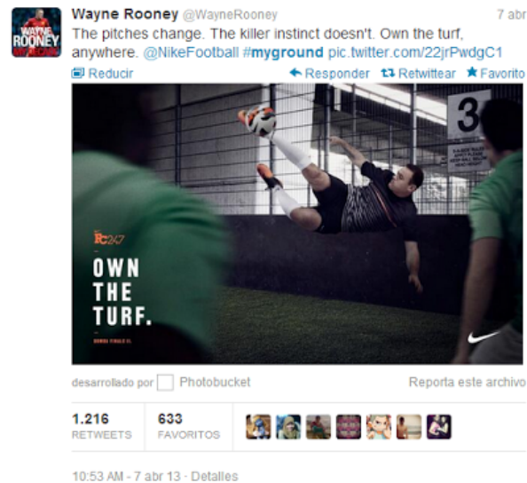
Figura 11. Tuit de Wayne Rooney para campaña de @NikeFootball

En España, uno de los casos más polémicos, que provocó el malestar entre usuarios que tacharon los mensajes de publicidad encubierta por su escasa sutileza y nula credibilidad, es el de Danone. En julio de 2013, varios famosos españoles –Nuria Roca, Carolina Cerezuela, Jesús Vázquez o Santi Millán, entre otros– publicaron en sus perfiles de Twitter un mensaje con la etiqueta #porfincalor. Lo que parecía ser un simple mensaje personal publicado libre y voluntariamente, ya que no se indicaba que fuera un tuit patrocinado, resultó formar parte de una campaña de Danone para el lanzamiento de su nuevo producto Yolado. Carolina Cerezuela fue la única que integró el hashtag #publi dentro de su mensaje.