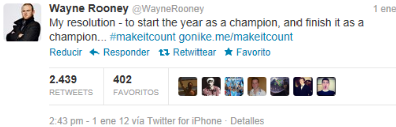
Figura 10. Tuit de Wayne Rooney para la campaña de Nike #makeitcount

Nike. En el primer caso, el mensaje incluía la etiqueta de la campaña publicitaria de la marca deportiva (#makeitcount) y un enlace a la página web, pero la resolución de The Advertising Standards Authority (ASA) estimó la reclamación contra el tuit al considerarlo publicidad encubierta e instó a Nike a retirar el controvertido mensaje, reclamando que se identificaran futuras campañas similares para evitar cualquier riesgo de confusión. Para el ASA, ni la estructura ni el contenido del tuit revelaban suficientemente su carácter promocional y, contrariamente, su diseño y tono hacían pensar que se trataba de un mensaje personal y espontáneo.