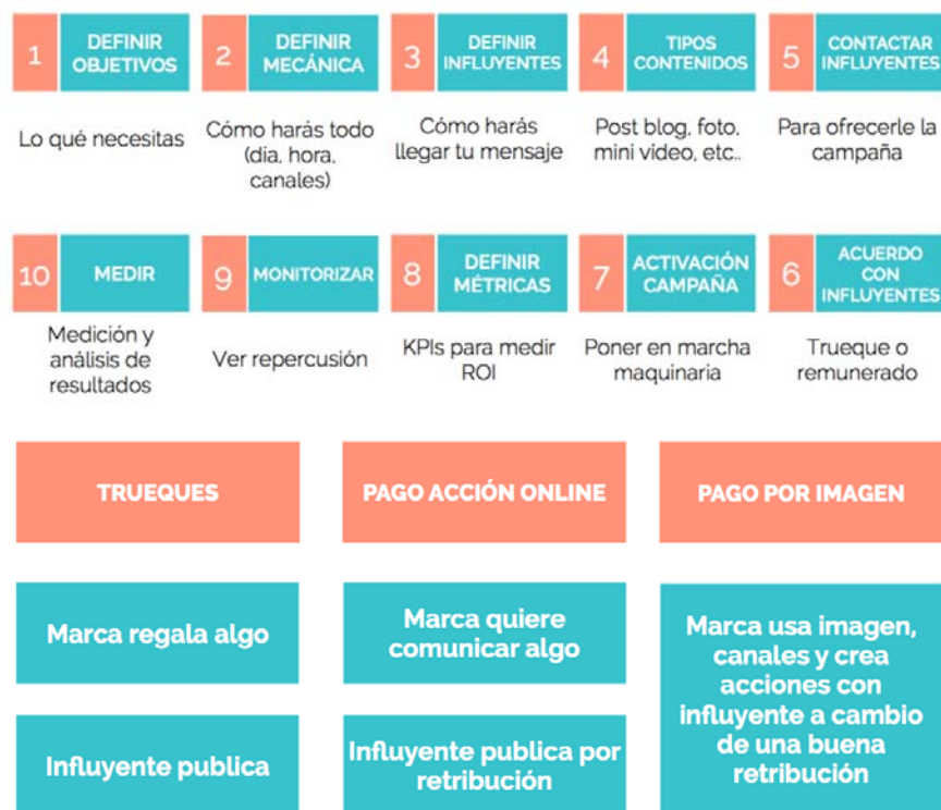
Figura 8. Estrategia de marketing de influencia según Vilma Núñez 15

Una de las premisas para que el marketing de influencia resulte efectivo es crear contenidos en los que la imaginación sea un componente relevante y la distribución del contenidos se lleve a cabo de manera diferente, con una estrategia premeditada, reposada, y con una planificación en donde se pueda prever –dentro de lo posible, habida cuenta de que por la propia naturaleza de las redes sociales los efectos en éstas son, en la mayoría de las ocasiones, poco previsibles- dedicación, cálculo de consecuencias y efectos del feedback. En este sentido, Núñez sintetiza la estrategia del marketing de influencia de la siguiente manera: