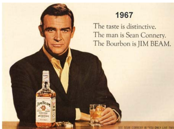
Figura 4. Sean Connery prestando su imagen a Jim Beam Bourbon en la década de 1960

admiramos, cuya presencia ante un producto nos coloca en un estado de vulnerabilidad tal que de forma no consciente se activan los mecanismos emocionales en los que transferimos todo tipo de bondades al producto, por el mero hecho de una asociación positiva. De forma ilusoria y guiados por el subconsciente el discurso permea y es retenido en la mente del consumidor.