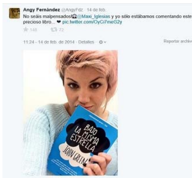
Figura 9. Tuit de @angyFdz sobre la novela “Bajo la misma estrella”

Al albur de estos datos y ejemplos, resulta evidente que la comunicación en general y la publicidad de forma concreta, toma nuevas formas en la era de las redes sociales. Tomando como referencia el ejemplo anterior, en cualquier otro momento estos dos actores habrían protagonizado un spot publicitario para ser emitido en horario de máxima audiencia en todas las cadenas de televisión. Sin embargo, el marketing de influencia permite segmentar, llegar a los seguidores de ambos y dirigir la conversación sobre el objetivo, construyendo para ello un discurso exento de la agresividad comercial propia de la publicidad convencional.