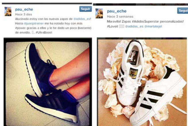
Figura 3. Publicaciones de la actriz y bloguera Paula Echevarria en Instagram sobre productos Adidas

Un ejemplo de esta tendencia a asociar marcas con líderes de opinión o personajes conocidos públicamente a través de espacios de la Web 2.0 es el fenómeno de las blogueras de moda, que constantemente aconsejan en sus blogs y espacios en redes sociales productos de marcas que se los prestan o regalan buscando lograr gracias a sus audiencias máxima visibilidad con mínima inversión. Estas “it girls”, a quienes se les presupone independencia y credibilidad, se han convertido en nuevas prescriptoras imprescindibles para la estrategia de marketing de cualquier marca de moda, llegando a cobrar hasta 450 euros por tuit y 12.000 euros por amadrinar un evento 4 .