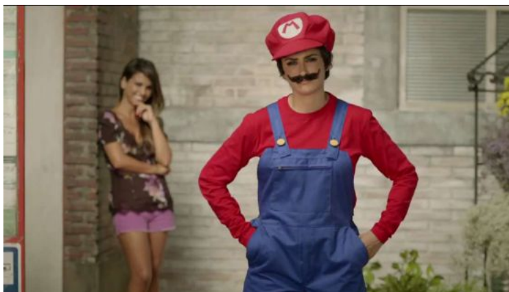
Figura 2. Spot promocional de New Super Mario Bros. 2 para Nintendo 3DS en 2012 con Penélope Cruz y Mónica Cruz

Un ejemplo de esta tendencia a asociar marcas con líderes de opinión o personajes conocidos públicamente a través de espacios de la Web 2.0 es el fenómeno de las blogueras de moda, que constantemente aconsejan en sus blogs y espacios en redes sociales productos de marcas que se los prestan o regalan buscando lograr gracias a sus audiencias máxima visibilidad con mínima inversión. Estas “it girls”, a quienes se les presupone independencia y credibilidad, se han convertido en nuevas prescriptoras imprescindibles para la estrategia de marketing de cualquier marca de moda, llegando a cobrar hasta 450 euros por tuit y 12.000 euros por amadrinar un evento 4 .