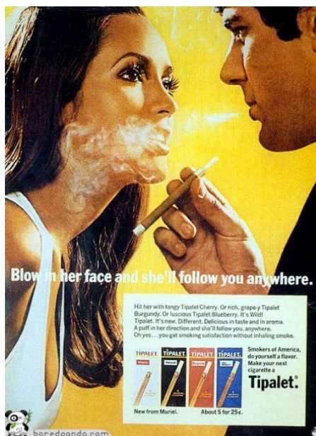
Figura 6. Campaña de cigarrillos Tipalet y su particular manera de entender la persuasión publicitaria, bajo la posible explicación de los diferentes sabores de tabaco de la marca: cereza, arándano y uva, entre otros (años 60)

Un parámetro de vital importancia a considerar al analizar la figura del prescriptor publicitario es apostar por una verdadera y creíble relación en primera instancia entre el producto y el propio famoso. Solamente si ese vínculo es sostenible, veraz y suficientemente sólido se podrá fijar una relación biunívoca, de mutua influencia, que trascenderá al universo social para, a su vez, influenciar en el receptor, llamémosle a éste público objetivo, usuario o simplemente consumidor. En la historia de la comunicación publicitaria encontramos casos palmarios de intentos de relación frustrada, como la compañía farmacéutica americana de analgésicos Datril, que tras un proceso de negociación arduo, acabó convenciendo al agente del actor John Wayne para que éste le prestara su imagen. Acostumbrado el público a las proezas de Wayne y a su particular forma de abordar el peligro, no resultó del todo creíble su manera de pelear contra el dolor de cabeza, no favoreciéndose el proceso inconsciente de transferencia, identificación e influencia necesarios para, en este caso, activar las ventas.