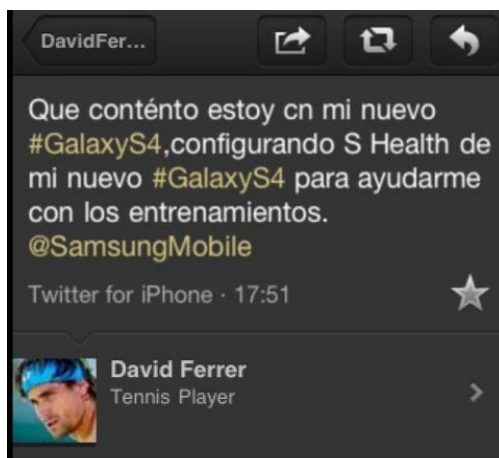
Figura 7. Tuit de David Ferrer sobre el móvil Samsung Galaxy S4

Otro notorio caso de marketing de influencia relacionado con una figura relevante o celebrity, en este caso también un deportista, fue el protagonizado por el tenista David Ferrer y Samsung Galaxy 4. Aprovechando su participación en el Mutua Madrid Open 2014, patrocinado por la empresa surcoreana, Ferrer lanzaba un tuit en su perfil de la red social que contenía el siguiente mensaje: